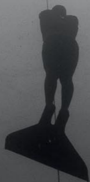
Bonaire biedt kalm en helder water met grote diepte vlak onder de kust.

Carlos kan op een halve long naar vijftig meter duiken.