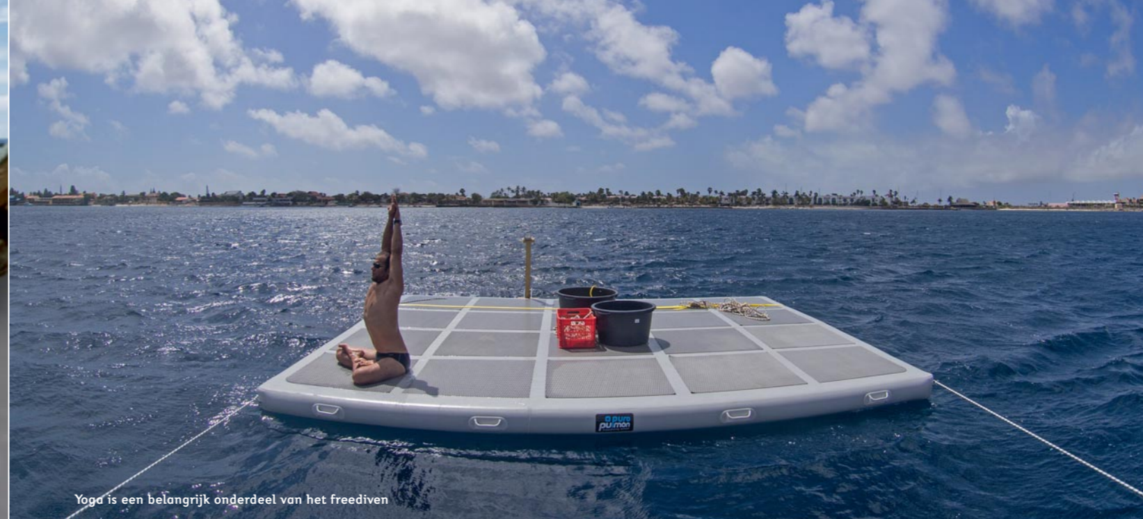
Yoga is een belangrijk onderdeel van het freediven