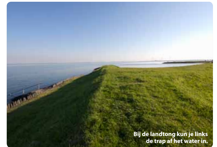
Bij de landtong kun je links de trap af het water in.