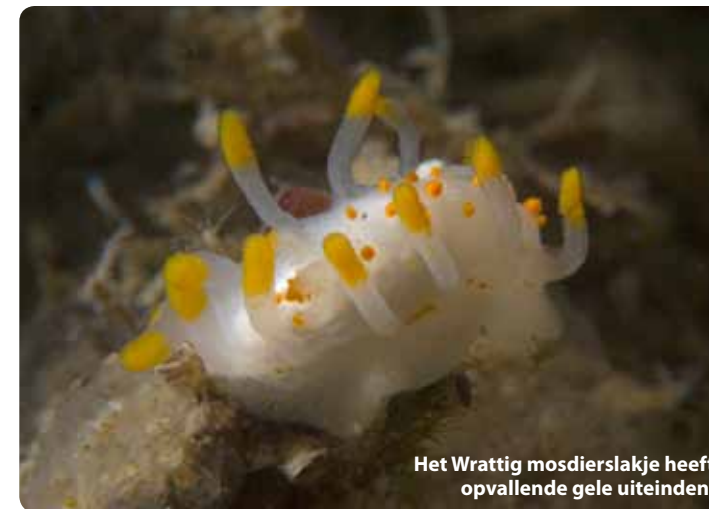
Het Wrattig mosdierslakje heeft opvallende gele uiteinden.