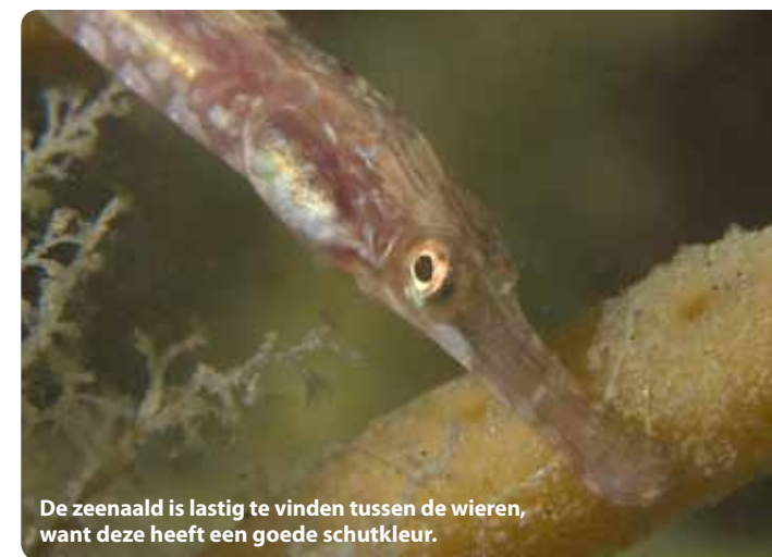
De zeenaald is lastig te vinden tussen de wieren, want deze heeft een goede schutkleur.