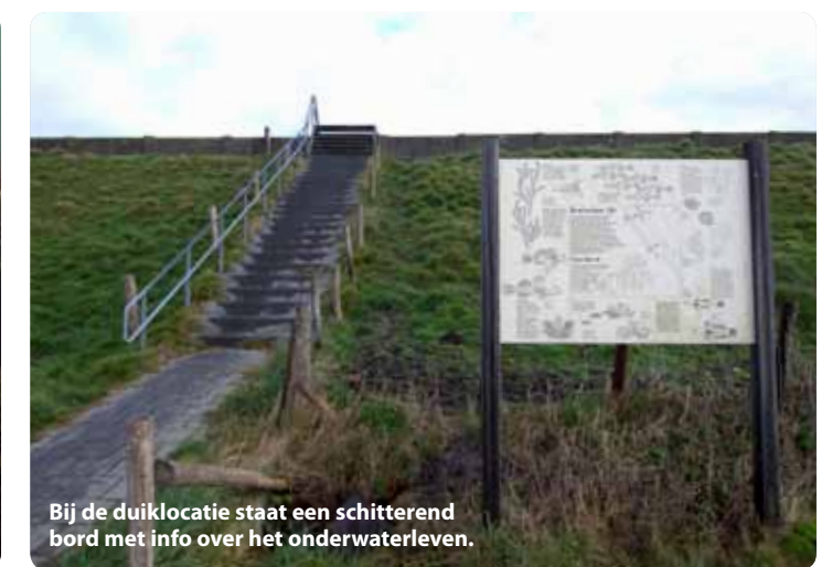
Bij de duiklocatie staat een schitterend bord met info over het onderwaterleven.