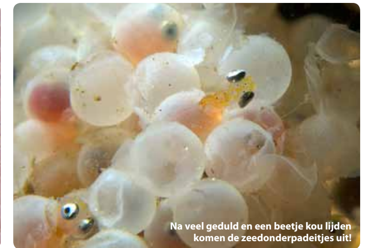
Na veel geduld en een beetje kou lijden komen de zeedonderpadeitjes uit!