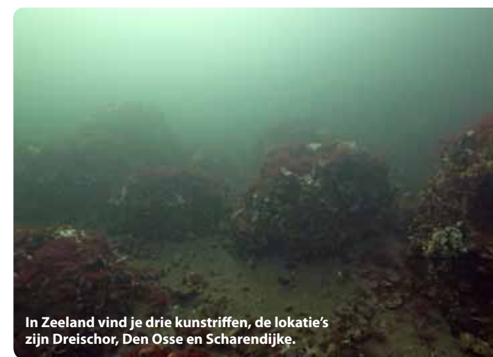
In Zeeland vind je drie kunstrippen, de lokatie's zijn Dreischor, Den Osse en Scharendijke.